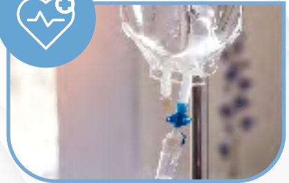
Procedimientos de enfermería